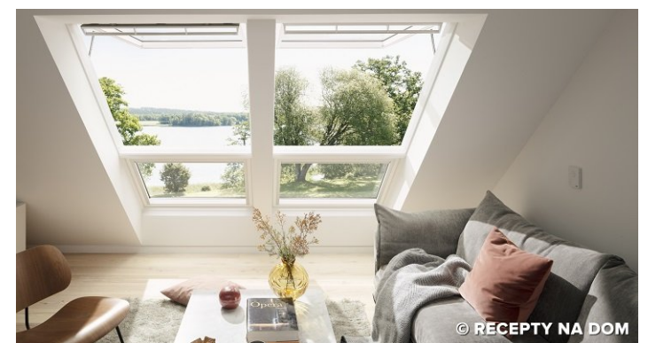
PANORAMICZNY WIDOK Z NOWYM OKNEM ELEKTRYCZNYM VELUX