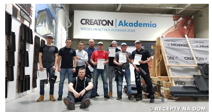
NOWY SEZON SZKOLENIOWY W AKADEMII CREATON