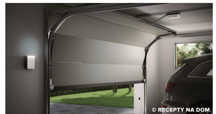
NOWE SIŁOWNIKI DO BRAM GARAŻOWYCH SPY I SPY HI-SPEED MARKI NICE

Szybkość ma znaczenie, zwłaszcza gdy chodzi o bezpieczeństwo. Nice uważnie obserwuje potrzeby konsumentów i konsekwentnie odpowiada na nie, dlatego wprowadza na rynek